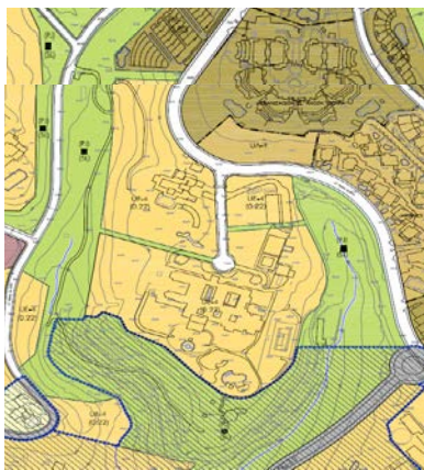
PGOU: Situación en el Plano de Ordenación Completa

La innovación presentada propone una zonificación, en lo que a la delimitación del suelo destinado a espacios libres se refiere, ajustándola a la delimitación definida en el expediente de cesiones, incluyendo todos los suelos de titularidad pública destinados a este uso.