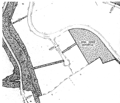
Delimitación de las zonas verdes públicas según el Expediente de Cesiones