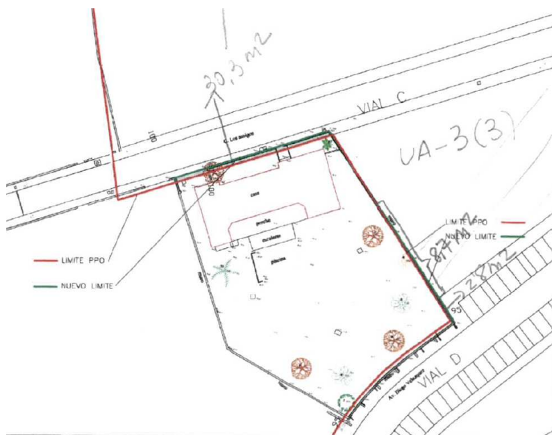
PLANO DE LA FINCA APORTADO

Analizada la documentación del Plan Parcial, se observa lo siguiente: